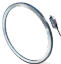
ITD89H00 系列 位置及速度反馈