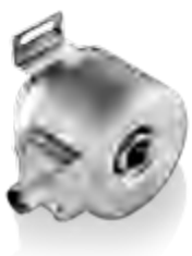
OptoPulse® EIL580/EIL580P 系列 位置及速度反馈

传统上，一般采用带正弦信号或方波信号的增量式编码器来采集电梯电机的转速信息。根据电梯类型和设计理念不同，电机控制还需要转子的绝对位置信息。带 SSI 或 BiSS C 接口的 EFL580 系列编码器堪称该应用的理想选择。