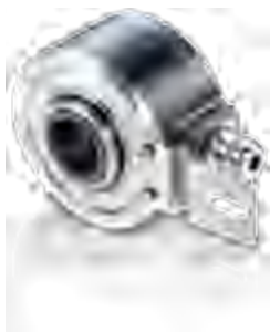
ITD 41 A4, ITD 61 A4 系列