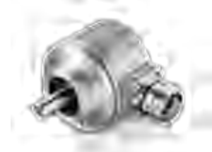
OptoPulse® EIL580 / EIL580P 系列 位置反馈