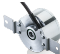
OptoPulse® EIL680 系列 位置及速度反馈