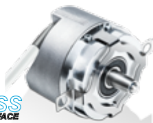
EFL580 BiSS C 系列 位置及速度反馈