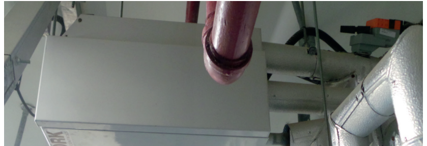
Die Gebläsekonvektoren sind mit den elektronisch druckunabhängigen Regelkugelhähnen (EPIV) von Belimo ausgestattet.