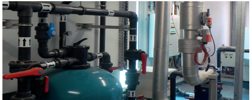
Die Rückkühler sind mit den Belimo Energy Valves™ ausgestattet.