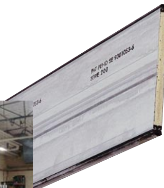
Patenterad tillverkning av spjällblad. I en högautomatiserad maskin valsas, profileras och sammanfogas "ändlösa" spjällblad.