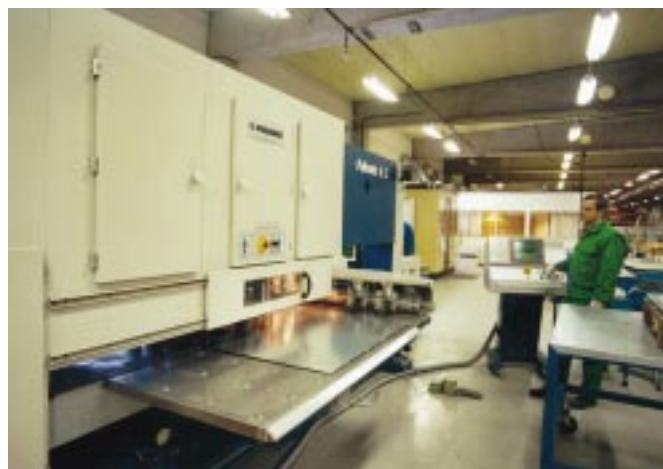
BeventRasch's datorstyrda stansmaskin arbetar med mycket hög precision.

Ofrivillig ventilation genom spjäll som är otäta på grund av felaktigt montage eller fel spjälltyp, ger årligen stora energiförluster. Förlusterna kan begränsas genom användande av spjäll med högre täthet.