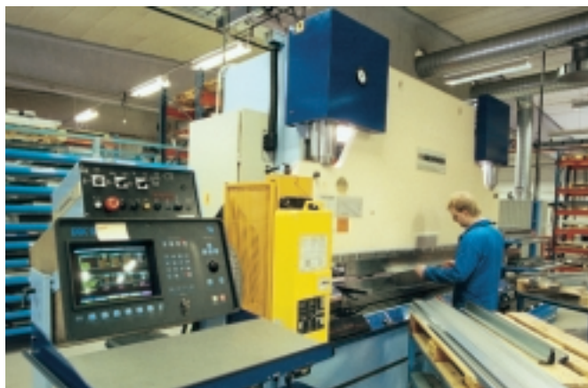
Datorstyrda kantpressar (ovan), nibblingsmaskiner samt moderna svets- och nitmaskiner som hanteras av yrkeskunliga medarbetare ger en hög produktkvalitet.

För att eliminera onödigt slitage på axlar och lagerupphängningar, skall spjäll alltid monteras med spjällaxlarna horisontellt. Observera att jalusispjäll som monteras skevt kan fordra betydligt större vridmoment än de redovisade.