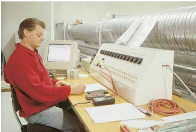
Inställning av flöden på VAV-don