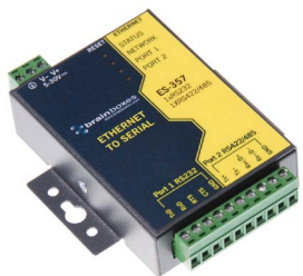
以太网到串行口的连接