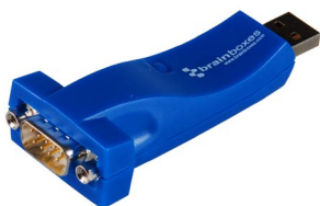
USB到串行口的连接 - 桌面应用型