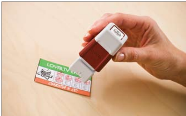
Selbst kleine Schriftgrößen sind dank der hohen Druckauflösung der Stempel gut lesbar

Mit vielen verschiedenen Möglichkeiten wie Rahmen, Clip Arts, Fotos, Logos, Unterschriften. Die Möglichkeiten sind unendlich.