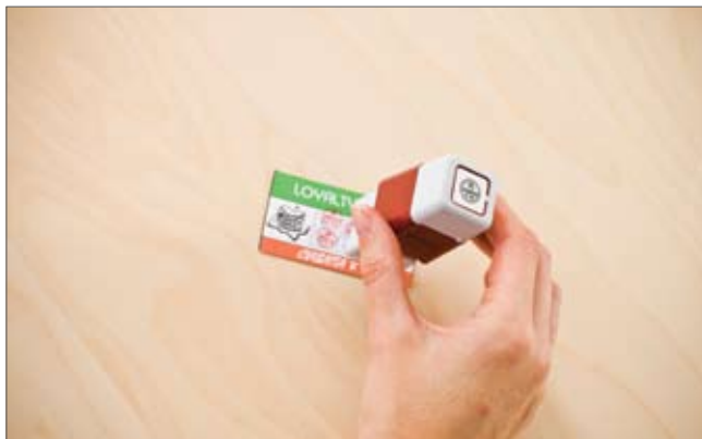
Die Stempel sind mit bis zu 50.000 Abdrucke äußerst langlebig