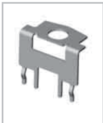
Fig. 2: Detail latch lock Abb. 2: Detail Rastelement