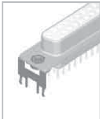
Fig. 1: Latch lock mounted on connector Abb. 1: Rastelement am Steckverbinder montiert