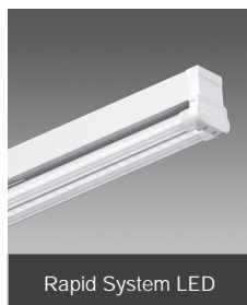
Rapid System LED

All'interno del Centro Commerciale Tiburtina, nei pressi di Guidonia Montecelio, Moby Dick ha aperto un suo nuovo punto vendita di oltre 1.200 metri quadrati: si tratta di una catena di negozi in cui è possibile trovare migliaia di ottimi prodotti e accessori per i nostri amici a quattro zampe. Il negozio è stato illuminato da Disano con un suo storico prodotto, Rapid System LED: la scelta di usare apparecchi a Led è stata dettata dal loro elevato risparmio energetico, soprattutto in un ambiente in cui la luce rimane accesa per tantissime ore al giorno.