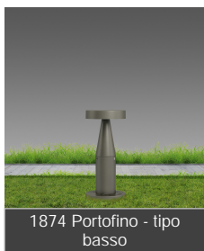
1874 Portofino - tipo basso

Le sorgenti Led di ultima generazione ad alta efficienza (95 lm/W), con una temperatura di colore di 4000K e un alto indice di resa cromatica (CRI 80), assicurano una durata di vita di 50 000 ore. Portofino si distingue anche per l'alta qualità dei materiali, con corpo e colonna in alluminio pressofuso con alettature di raffreddamento, grado di protezione IP65, diffusore in policarbonato infrangibile e autoestingente. In dotazione, il connettore per il collegamento alla linea elettrica e la basetta per l'eventuale installazione a parete.