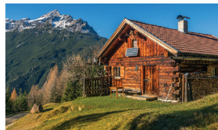
ELED9/DES/BM 941 335 189