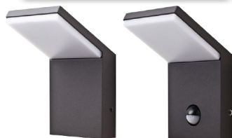
ELED9/DES 941 334 109