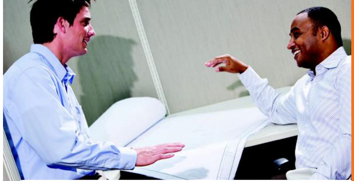
מנקודת המבט של Esterline:

◀ אנחנו לא מנצלים לרעה אפשרויות שיכולות להיטיב עם החברה כדי להפיק רווח אישי. מצופה מכם לקדם את ענייני החברה כחלק מעבודתכם. אם במסגרת עבודתם למדתם על הזדמנות שיכולה להיטיב עם Esterline, אסור לכם לנצל אותה כדי להפיק רווח אישי על חשבון החברה.