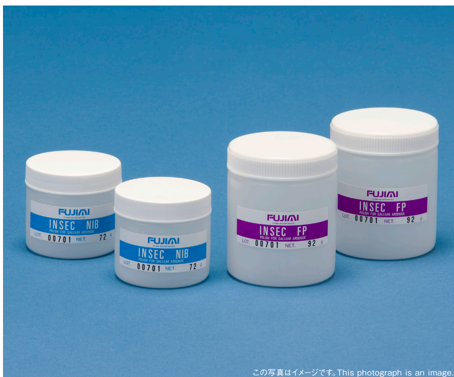
この写真はイメージです。This photograph is an image.