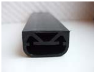
Profil ohne Klebeband