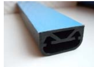
Profil mit Klebeband