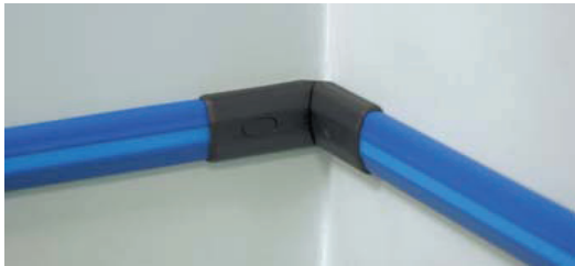
Innenecke und Außenecke sind nicht aktiv