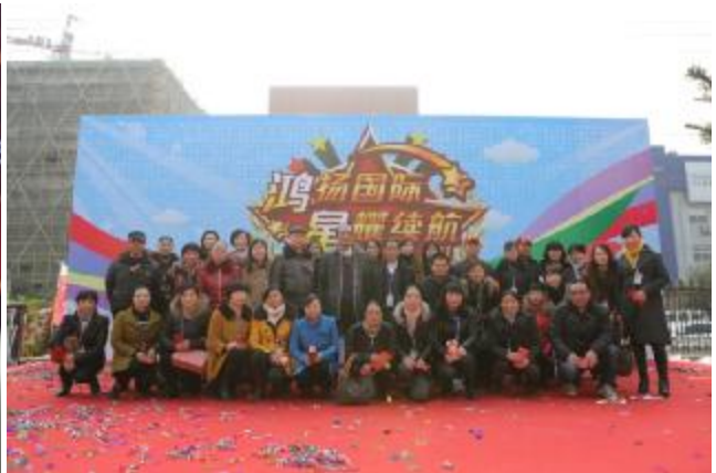
向工作满20年员工发放红包