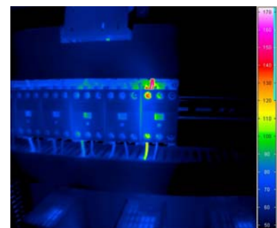
Abb. 2: Leistungsschalter – defekter Anschluss