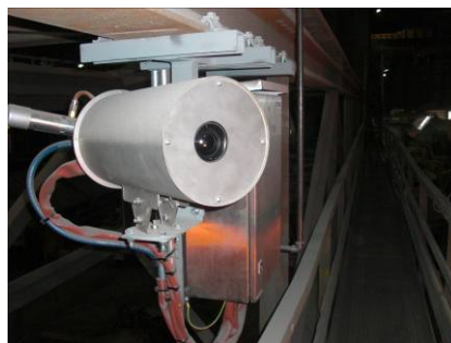
Wärmebildkamera im Schutzgehäuse