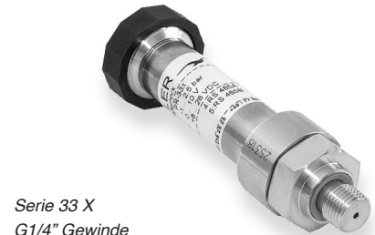
Serie 33 X G1/4" Gewinde

Diese Transmitter können mittels Korrektur der Verstärkung mit der PROG30 Software an jeden Standard Ihrer Wahl angepasst werden.