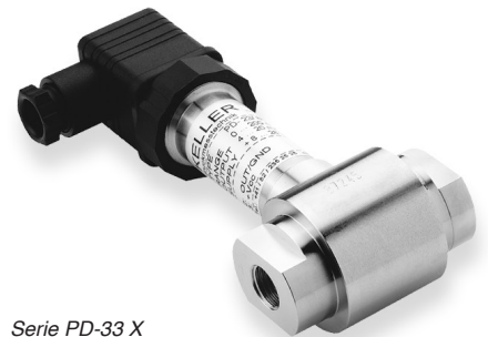
Serie PD-33 X