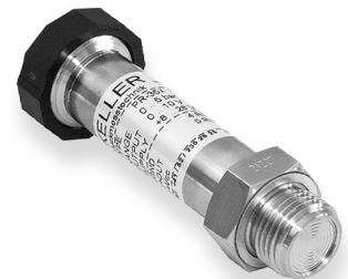
Serie 35 X G1/2", frontbündige Membrane