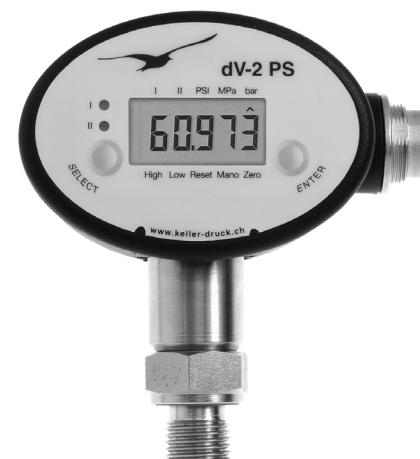
Manomètre à seuil dV-2 PS