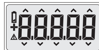
Segments du dV-2