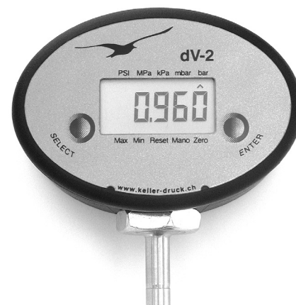
Manomètre numérique dV-2