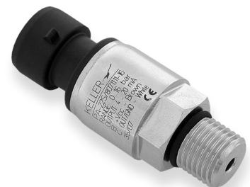
Serie 22 S G1/4"