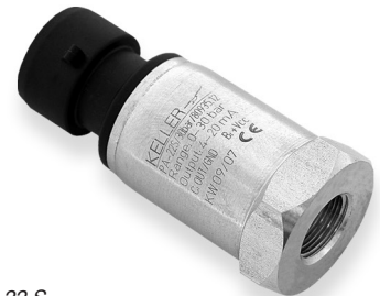
Serie 22 S 7/16"-20 UNF