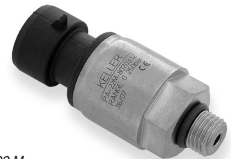
Serie 22 M 3/8"-24 UNF-2A