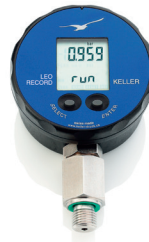
LEO Record Précision : 0,1%