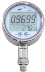
LEO 5 Précision : 0,05%