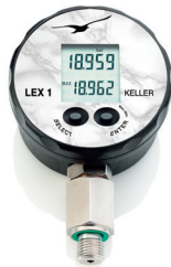
LEX 1 Précision : 0,05%