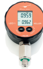
LEO 1 Précision : 0,2%