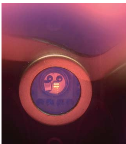
Bild 3. Das Laserarray Specdilias-V-763-MTE besteht aus zwei Reihen á vier Single Mode VCSEL und ist auf einem Peltierelement aufgebaut

Die Rauschwerte sind optimiert. Es wird eine Kohärenzlänge von zirka 8 m erreicht. Sollte dies nicht ausreichen, können noch rauschärmere Versionen kundenspezifisch gefertigt werden. Die Handhabung ist einfach, der User muss nur eine (auch unregelmäßige) Spannung von 15 V bereitstellen. Eine AC-Modulation bis zu 10 kHz kann extern über ei-