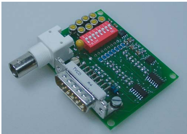
Bild 2. Die Ansteuerplatine LC-V8 der Laser Components ermöglicht die individuelle Ansteuerung von acht Single Mode VCSEL

nen Koppelkondensator aufgeprägt werden. Damit ist es etwa möglich, Stromrampen gemäß Bild 1 zu erzeugen. Eine Einkanalvariante wird unter der Bezeichnung ›LC-V1‹ angeboten.