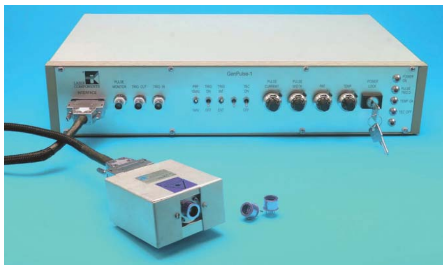
Bild 4. Der Genpulse ermöglicht einen komfortablen und einfachen Betrieb von QCLs der Quanta-Serie

Ein guter Single Mode (SM) VCSEL der Specdilias-V-Serie hat eine Bandbreite von unter 30 MHz (oder in Kohärenzlängen umgerechnet von mehreren zehn Me-