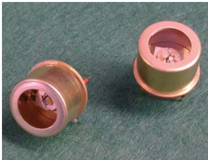
Bild 5. Der Laser Specdilias-Q-MTE der Quanta-Serie ist mit einem Peltierelement samt Thermistor ausgestattet und hermetisch verschlossen

Der Prototyp des ›Gempulse‹ (Bild 4) wurde erstmals im Januar 2003 auf der Photonics West einem größeren Publikum vorgestellt. Gempulse stellt eine Plattform für Quantenkaskadenlaser dar, wobei Chips von verschiedenen Herstellern zum ›Quanta‹-Laser konfektioniert werden (Bild 5).