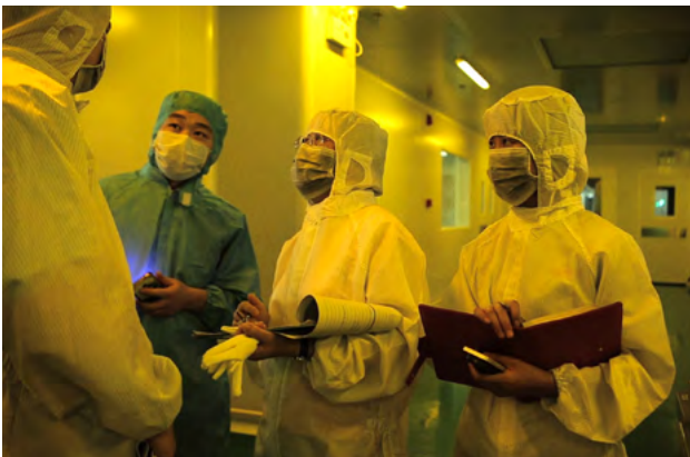
NCAB:n vuosittaisissa auditoinneissa kolme yrityksen työntekijää on tehtaalla kolmen päivän ajan.

"Tärkeää on myös se, että työskennellessään tilaustemme parissa yhteistyötehtaaita käyttävät vain meidän hyväksymiämme laitteita ja henkilökuntaa. Valitsemme parhaat työntekijät, käytämme useita tunteja heidän kouluttamiseensa ja varmistamme, että he käyttävät asianmukaisia laitteita. Näin yksilöimme yleisen valmistusprosessin meille sopivaksi. Tuomme siten asiakkaillemme lisäarvoa ja annamme heille enemmän, kuin mitä he saavuttaisivat yksin."