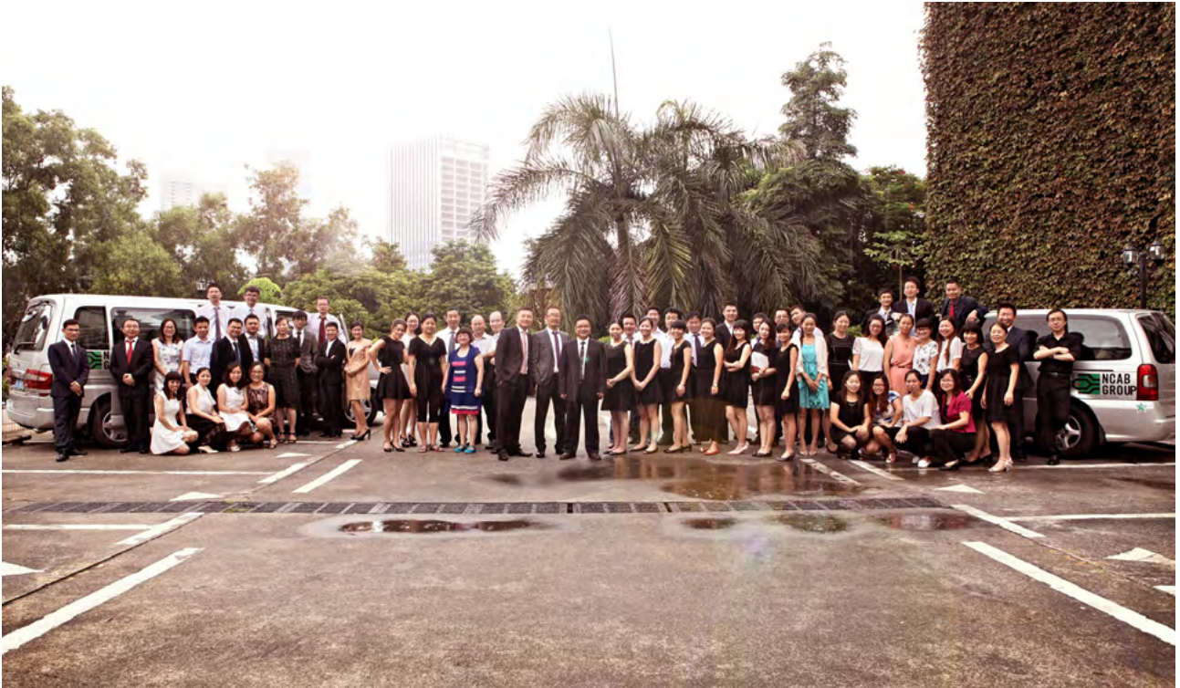
NCAB Groupin Kiinan toimistossa on 57 työntekijää, joilla on kattava ja perusteellinen piirilevytuotannon tuntemus. He valvovat ja seuraavat toimintaa paikan päällä.