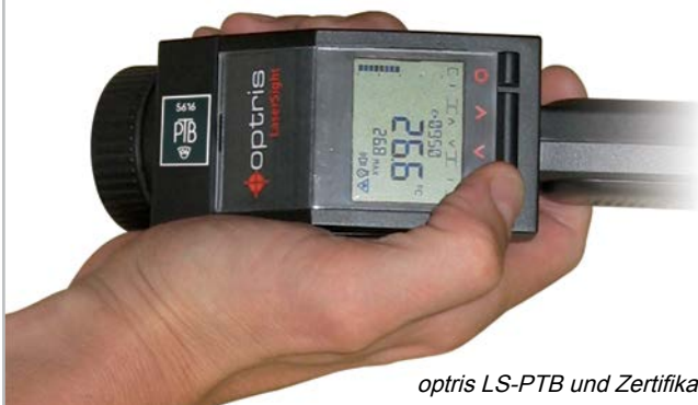
optris LS-PTB und Zertifikate des PTB

Die Optris GmbH verfügt über moderne firmeneigene Labore. Bei der Erstellung von Kalibrierzertifikaten wird neben der Raumtemperatur und Luftfeuchte des Kalibrierlabors auch der Messabstand und die Strahleröffnung (Kalibriergeometrie) protokolliert.