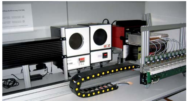
Automatisierte Kalibrierstation bei der Optris GmbH

Auf Grundlage des LS-PTB fertigt Optris die Gerätevariante LS-DCI als hochpräzises Referenz-IR-Thermometer für den Kunden. Die DCI-Geräte werden mit vorselektierten Bauteilen gefertigt, welche eine hohe Stabilität der Messung gewährleisten. In Kombination mit einer speziellen Kalibrierung an einer Vielzahl von Kalibrierpunkten erzielt das LS-DCI zudem eine höhere Genauigkeit als die Seriengeräte.