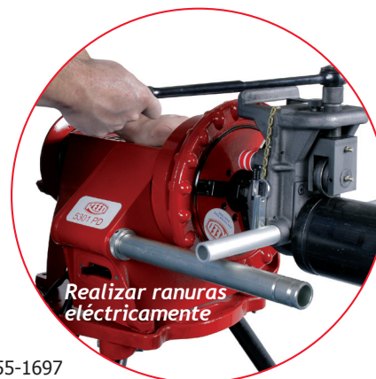
Realizar ranuras eléctricamente

La ranuradora de rodillo RGCOMBO2 está diseñada para usar con el dispositivo de toma de fuerza Reed #05301 5301PD. También se ajusta al dispositivo de toma de fuerza Ridgid® 300.