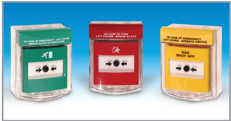
Una gama de colours disponibles