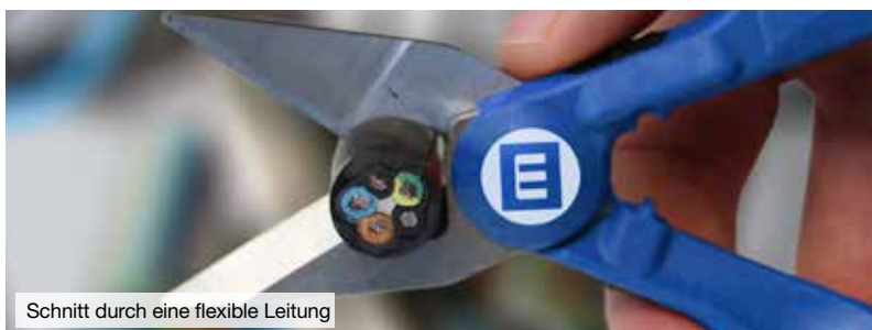
Schnitt durch eine flexible Leitung