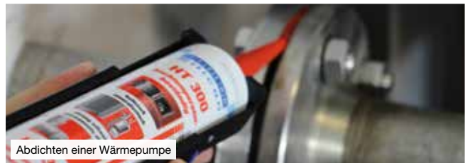
Abdichten einer Wärmepumpe

Elastische Kleb- und Dichtstoffe werden heute in vielen Bereichen der industriellen Fertigung und Montage verwendet. Sie kombinieren die Vorteile der Kleb- und Dichttechnologie und werden überall dort eingesetzt, wo hohe Anforderungen an die Elastizität und Dichtwirkung einer Fügeverbindung gestellt werden.