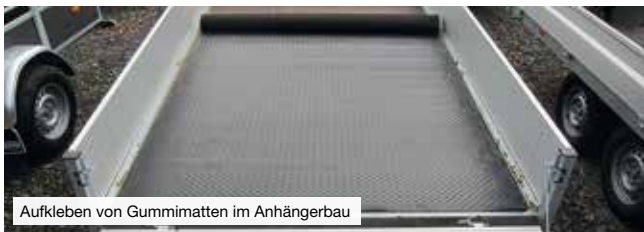
Aufkleben von Gummimatten im Anhängerbau

GMK 2410 ist ein Klebstoff auf Basis von Polychloropren (CR) mit einer hohen Anfangshaftung zur vollflächigen und flexiblen Verklebung von: