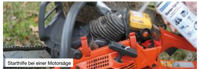
Starthilfe bei einer Motorsäge