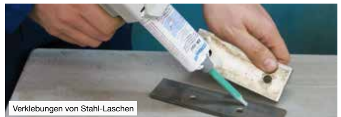
Verklebungen von Stahl-Laschen