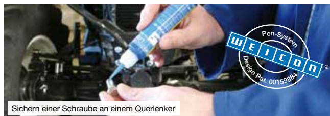
Sichern einer Schraube an einem Querlenker

Nach der Aushärtung entsteht eine vibrations- und stoßfeste Klebverbindung, die beständig gegen Chemikalien, Lösungsmittel und Temperaturen von -60°C bis +150°C ist.