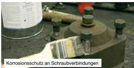
Korrosionsschutz an Schraubverbindungen

Wirksamer Schutz gegen Korrosion, Festfressen und Verschleiß, Oxidation und Passungsrost und elektrolytische Reaktionen („Kaltverschweißen“).