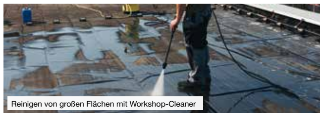
Reinigen von großen Flächen mit Workshop-Cleaner

Sie dienen der Pflege und dem Schutz von Oberflächen, zum Reinigen und Entfetten, Schmieren, Lösen und Trennen und sind unverzichtbarer Bestandteil der täglichen Arbeit.