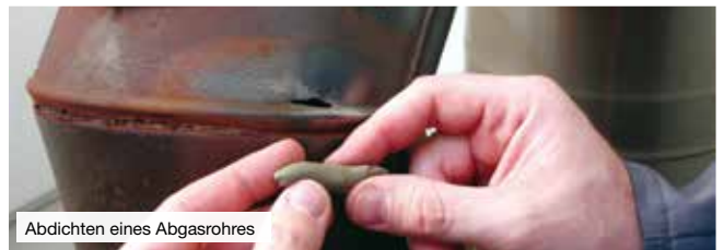
Abdichten eines Abgasrohres