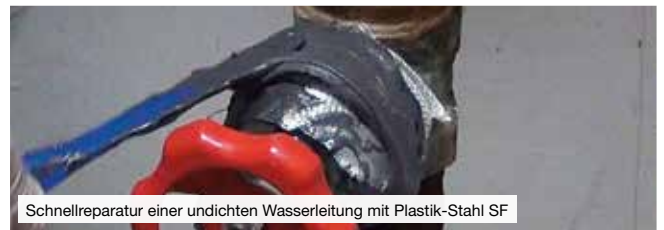
Schnellreparatur einer undichten Wasserleitung mit Plastik-Stahl SF