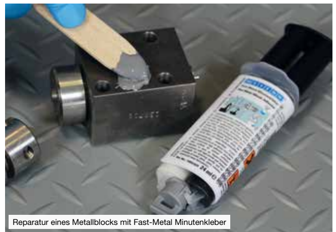
Reparatur eines Metallblocks mit Fast-Metal Minutenkleber