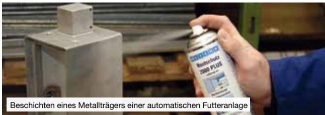
Beschichten eines Metallträgers einer automatischen Futteranlage