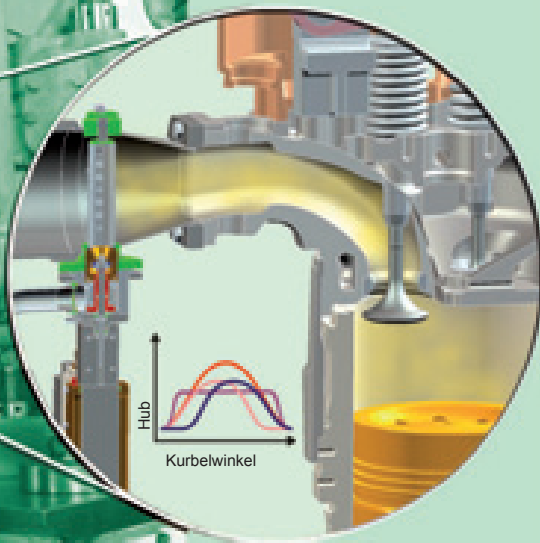
Variables Gasventil in einem mittelschnelllaufenden Gasmotor Variable Gas Valve in a Medium Speed Gas Engine